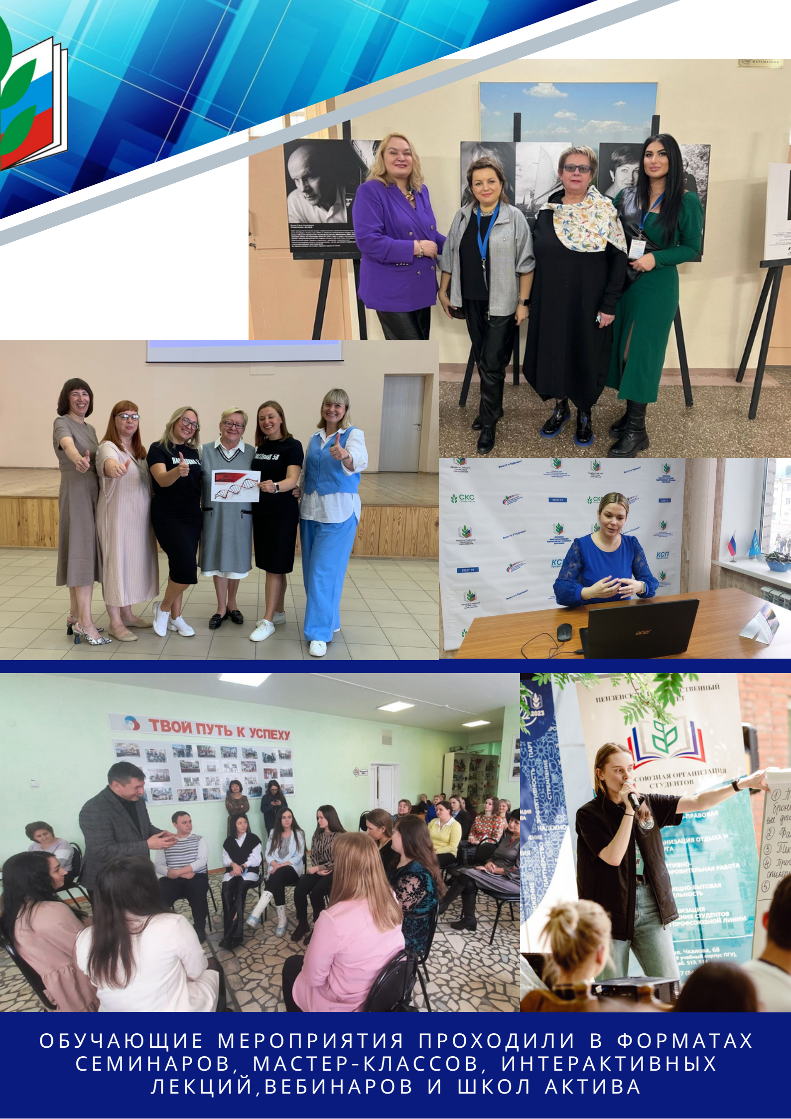
ОБУЧАЮЩИЕ МЕРОПРИЯТИЯ ПРОХОДИЛИ В ФОРМАТАХ СЕМИНАРОВ, МАСТЕР-КЛАССОВ, ИНТЕРАКТИВНЫХ ЛЕКЦИЙ, ВЕБИНАРОВ И ШКОЛ АКТИВА